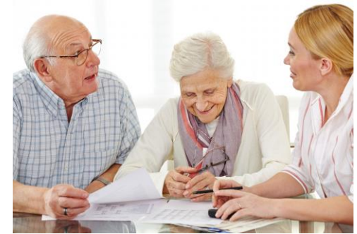
Pieaugušo izglītības sektors KA210-ADU