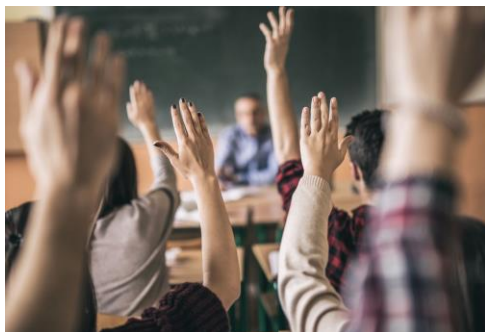
Skolu izglītības sektors