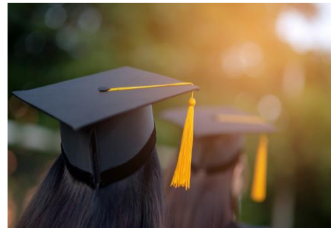
Augstākās izglītības sektors