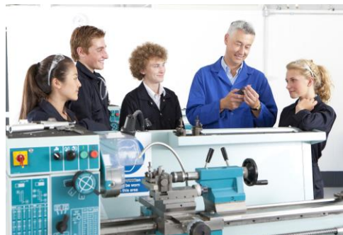
Profesionālās izglītības sektors