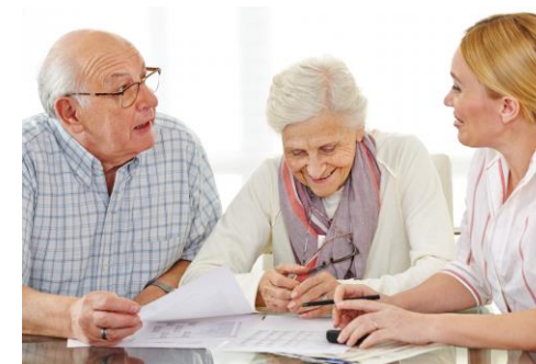
Pieaugušo izglītības sektors