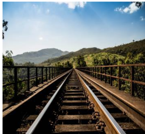
VIDE UN CĪŅA PRET KLIMATA PĀRMAIŅĀM