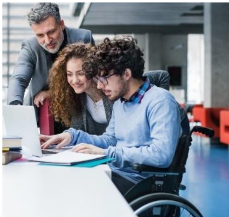
IEKĻAUŠANA un DAUDZVEIDĪBA