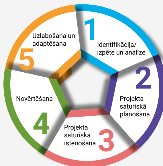
2. attēls. Projekta dzīves cikls.

5. Uzlabošana un adaptēšana: pamatojoties uz novērtēšanas rezultātiem, tiek veiktas nepieciešamās izmaiņas nākamajos projektos vai turpmākajās izglītības iniciatīvās. Šis posms ietver projektā konstatēto trūkumu novēršanu, uzlabojumu ieviešanu un pielāgošanu, lai panāktu labākus rezultātus nākotnē.