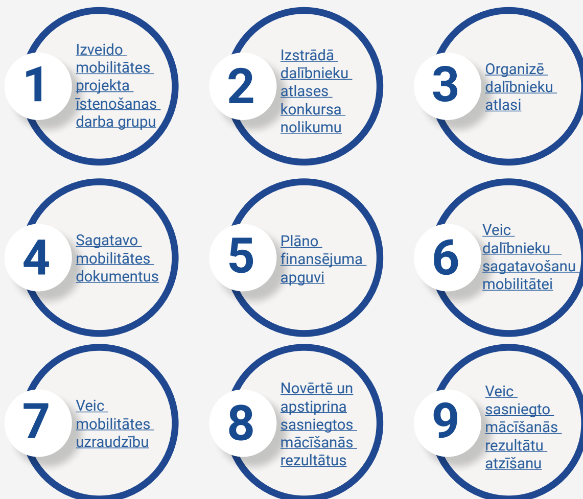
4. attēls. Ieteicamie soļi mobilitātes projekta saturiskai īstenošanai.

Mobilitātes projekta saturiskā īstenošana ietver projekta pārvaldību, lai nodrošinātu, ka tas atbilst plānošanas un izstrādes posmos noteiktajiem mērķiem, īstenojamajām darbībām un sasniedzamajiem rezultātiem. Ieteicamos soļus mobilitātes projekta saturiskai īstenošanai skatīt 4. attēlā.